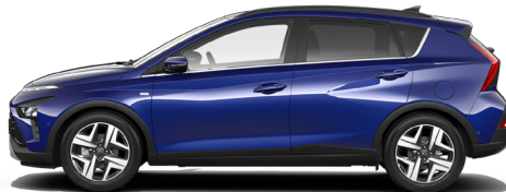
Intense Blue Pearl Kontrastdach verfügbar