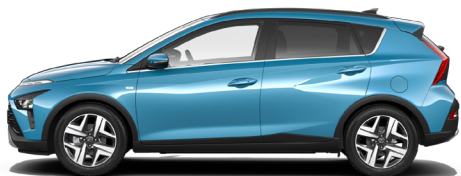
Aqua Turquoise Metallic