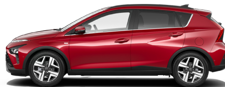
Dragon Red Pearl Kontrastdach verfügbar